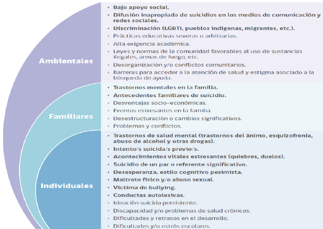
FIGURA 1. FACTORES DE RIESGO CONDUCTA SUICIDA EN LA ETAPA ESCOLAR