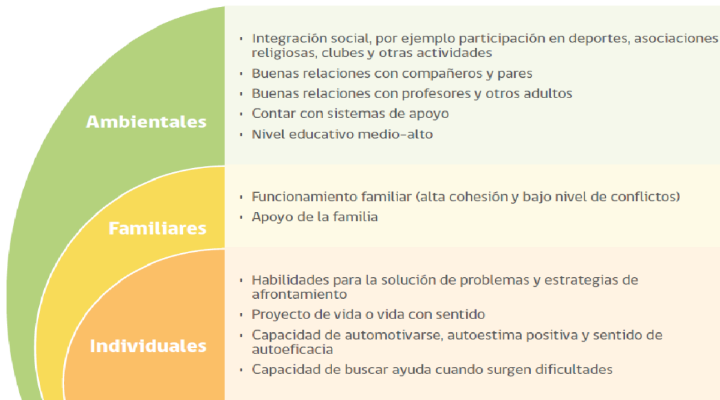
FIGURA 2. FACTORES PROTECTORES CONDUCTA SUICIDA EN LA ETAPA ESCOLAR